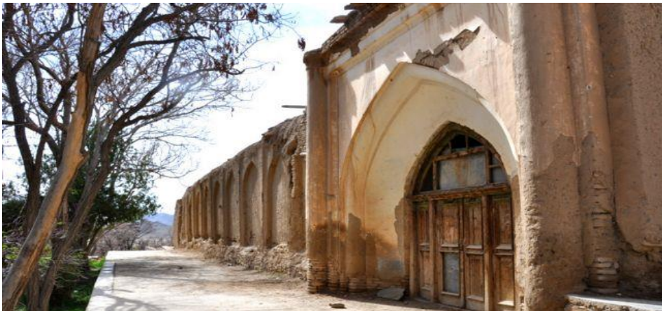
شکل شماره (۳) مدرسه سلطان محمود ( https://bakhshiofficial.com ).

زیادی مالی و غذایی جهت مخارج مسجد و مدرسه و طالبان علم و دانش توسط سلطان اختصاص داده شد و این مسجد را به نام عروس الفلک نام نهادند و فعلاً به جای آن مسجدی جدیدی قرار دارد به نام مسجد جامعه اولیا (خوگیانی، ۱۳۹۱: ۸۳). هنر معماری این مسجد سلطان محمود متأثر از هنر معماری سامانی بود و هنر صنعت این بنا کاملاً خراسانی بود ولی بعدها برخی نوآوری‌ها در هنر معماری این دوره مشاهده می‌گردد (سلیم، ۱۳۸۳: ۶۱-۶۲). هم‌چنان از کارهای عام‌المنفعه دیگر معماری عهد غزنوی بند و یا سدی بزرگی است به یادبود سلطان محمود غزنوی بروی رود غزنی اعمار گردیده است، که از برکت این بند زمین‌ها و باغ‌های زیادی سیراب می‌گردد، در وصف این سده آمده است که محمود بر آب زره بندی بسته است که برسر آن بند شهری و دوازده روستای است و آن را بند یاد می‌نمایند (فروزانی، ۱۳۸۷: ۴۳۰).