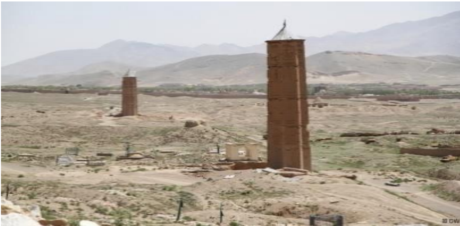
شکل شماره (۲) منار سلطان مسعود - بهرام شاه ( https://bakhshiofficial.com ).

حصار نای: حصار نای نیز یکی از آبدات تاریخی عهد غزنوی به شمار رفته است. هرچند در موقعیت جغرافیای این حصار و یا قلعه نظامی تصویر روشنی ارائه نگردیده است. برخی این قلعه را در بین غزنی و هند می‌جویند. اما مورخ و دانشمند بزرگ این عصر ابوریحان البیرونی می‌نویسد: "سلطان مسعود غزنوی به من ظرایفی را اهدا داشت که در آن جمله سنگی سیاهی بود از قلعه نای نزدیک غزنی و هندویی که از کارداران این قلعه بود به من گفت که هندوان آن را به بتکده‌های خود می‌برند". عبدالحی حبیبی نوشته ابوریحان البیرونی را تأیید نموده و موقعیت این قلعه را در سمت غرب شهر غزنه و مایل به زاویه جنوب که اکنون هم در آن محل آثار آبادی‌ها به نام «نای قلعه» وجود دارد، می‌داند(-) کارگر، ۱۳۸۳: ۸۹-۹۰).