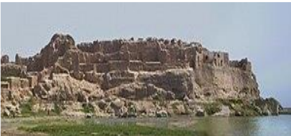
شکل شماره (۱) کاخ لشکری بازار.

کاخ لشکری بازار: یکی از معماری‌های عصر غزنوی هنوز برجای است، کاخ بزرگ لشکری بازار در کنار رود هیرمند است، به نظر می‌رسد که کارهای ساختمانی لشکری بازار (قصر زمستانی) از زمان سلطان محمود آغاز شده باشد. این مجموعه، یکی از جذاب‌ترین آثار معماری دوران غزنویان به شمار رفته است که آثار موجود در آن کاملاً مربوط به این دوره نیست زیرا در این مجموعه، آثاری از عهد سلسله غوری مشاهده می‌شود، این اثر معماری، اقامتگاهی مجلل محسوب می‌شده که شکلی مستطیلی داشته و دیواری‌های خشتی و ستر داشته است. در این آبنده تاریخی برج‌های نیمه استوانه‌ای تدافعی مشاهده می‌گردد، در این بنا، ۴ ایوان در